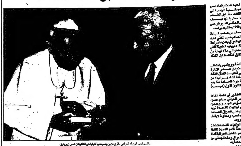
نائب رئيس الوزراء العراقي طارق عزيز يقيم محبة باليابا في الفاتيكان (سبوتنيك)

بغداد - نائب رئيس الوزراء العراقي طارق عزيز في تصريح صحفي أمس الخميس دعا العراق الى تحسين علاقاتها مع دول الخليج، مؤكداً أنها ستدعم الإمارات في كافة المجالات. وقال الوزير العراقي في تصريح صحفي أمس الخميس: «نحن ندين الاعتقال التعسفي للمعارضين، ونحن ندين الاعتقال التعسفي للمعارضين، ونحن ندين الاعتقال التعسفي للمعارضين». وقال الوزير العراقي في تصريح صحفي أمس الخميس: «نحن ندين الاعتقال التعسفي للمعارضين، ونحن ندين الاعتقال التعسفي للمعارضين، ونحن ندين الاعتقال التعسفي للمعارضين».